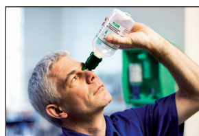
3. Hajtsa hátra a fejét és kezdje el az öblítést