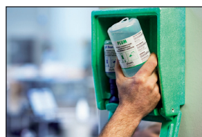
1. Vegye ki a flakont a tartóból