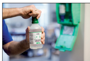
2. Csavarja a védőt ameddig a biztonsági gyűrű eltörik