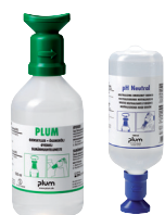
Plum szemkimosó pH Neutral