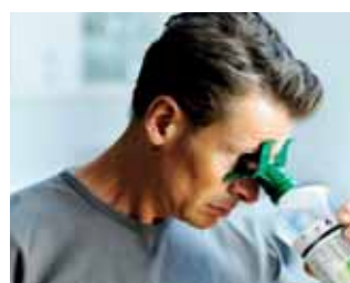
Následne môžete pokračovať vo vyplachovaní aj tak, že sa mierne predkloníte.