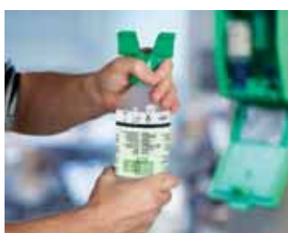
Otáčajte adaptérom v smere šípky, až kým sa uzáver roztrhne.