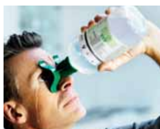
Nakloňte hlavu trochu dozadu, stlačte nádobu a začnite vyplachovanie.