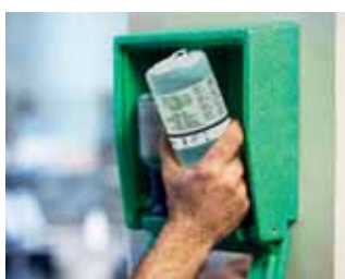
Používanie očnej sprchy PLUM je jednoduché, ak dôjde k úrazu očí.

Naše výrobky boli vyvinuté v spolupráci s očnými špecialistami. To znamená, že pri vytvorení očných sprch sme mysleli aj na najmenšie detaily. Piktogramami pomáhame správne mu používaniu. Adaptér pomáha mať oči otvorené pri vyplachovaní. Výplach sa tak dostane do očí na správnom mieste, rovnomerne a v optimálnom množstve.