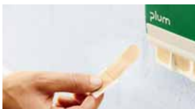
Scoateți plasturele din dozator. Acesta este utilizabil imediat...

Accidente minore se pot produce zilnic la locul de muncă. În cazul leziunilor minore e suficient aplicarea unui plasture. Alegeți plasturele potrivit locului Dvs. de muncă – sau combinațiile corespunzătoare! Oferim oportunități și muncitorilor din mediul general sau umed, chiar și celor din domeniul alimentar. Nu pierdeți vremea: scoateți un plasture din dozator, aplicați-l și puteți continua munca! QuickFix rezolvă rapid, igienic și eficient problemele.