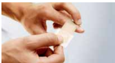
...poate fi aplicat cu o singură mână.