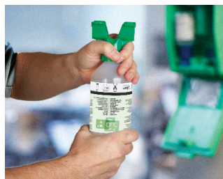
Otáčajte adaptérom v smere šípky, až kým sa uzáver roztrhne.