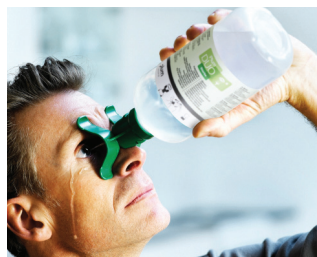
Nakloňte hlavu trochu dozadu, stlačte nádobu a začnite vyplachovanie.