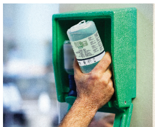
Používanie očnej sprchy PLUM je jednoduché, ak dôjde k úrazu očí.