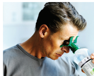
Následne môžete pokračovať vo vyplachovaní aj tak, že sa mierne predkloníte.